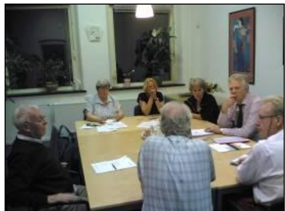
Overleg met de BOV bij Versa

Over onze activiteiten leest u in deze nieuwsbrief meer.