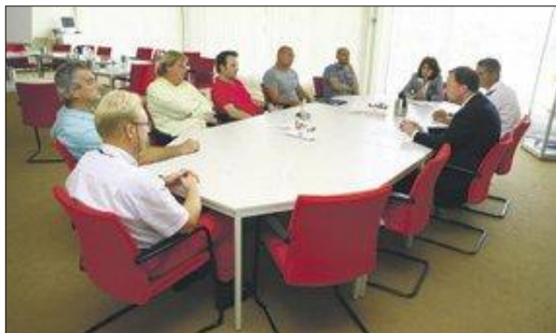
Ondertekening horecaconvenant op 2 juli 2009

Op 2 juli 2009 werd op het gemeentehuis het nieuwe horecaconvenant ondertekend. Dit convenant regelt afspraken tussen gemeente, politie en horecaondernemers en is mee ondertekend door Buurtpreventievereniging Brave Hendrik, het Comité Overlast De Koperen Kraan en De Boemel.